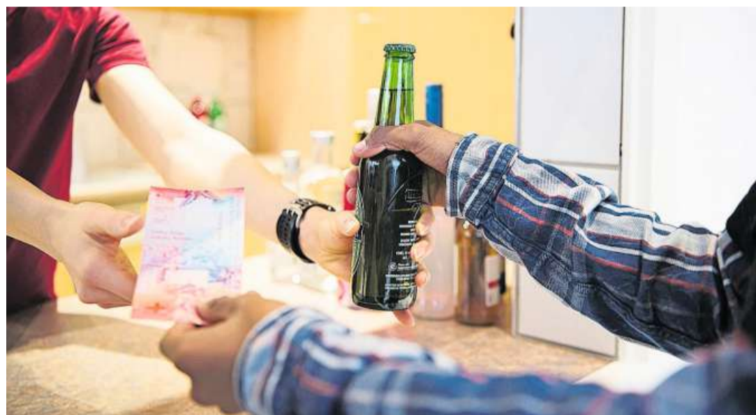
Immer wieder kommt es vor, dass Jugendliche Bier oder andere alkoholische Getränke kaufen können, obwohl sie nicht alt genug sind.

Von April bis Dezember 2022 fanden 115 Spirituosen-testkäufe und 9 Onlinetestkäufe statt, wie der Kanton am Dienstag mitteilt. Zusätzlich fanden 91 Bier- und Wein- sowie 41 Tabaktest-